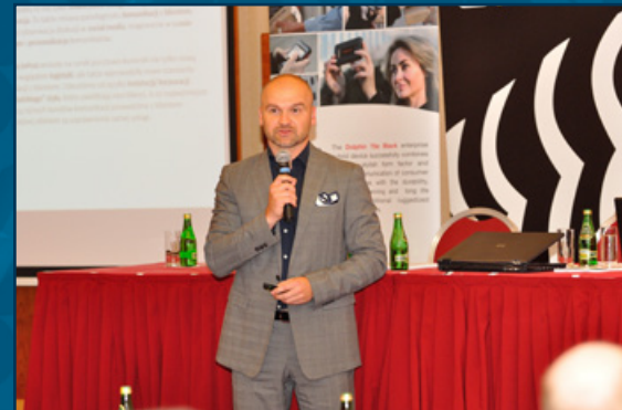
Rafał Brzoska, Właściciel InPost, prezentował rozwiązania omnichannel wdrożone w paczkomatach InPost. (Forum Technologiczne 2015)