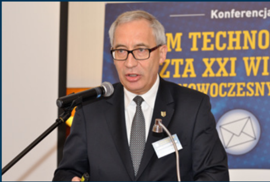
Minister Kazimierz Smoliński w trakcie wystąpienia otwierającego (Forum Technologiczne 2016)