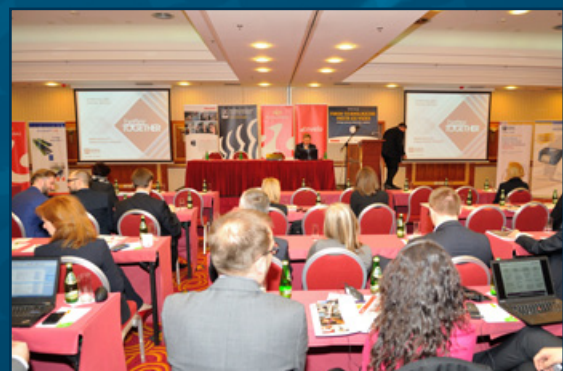
Uczestnicy w trakcie obrad Forum. (Forum Technologiczne 2015)