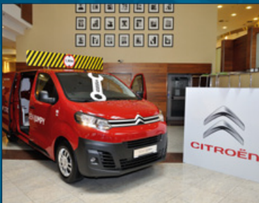
Stoiska w części wystawienniczej naszych konferencji

Michał Putkiewicz / M: +48 606 786 686 / e-mail: m.putkiewicz@adventure.pl